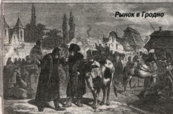
Рынок в Гродно

Внешние и внутренние обстоятельства обусловили образование в XII-XIII веках многонацио-