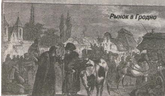
Рынок в Гродно

К Российской империи Принеманье было присоединено в 1795 году . Для большинства белорусов это было обретением бывлой восточно-